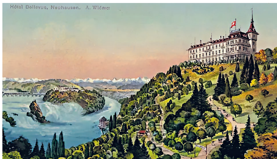
Hoch über dem Rheinfall thronte einst das 1863 erbaute Hotel Bellevue. Der charakteristische Turm verschwand nach dem Umbau 1952.

1999 ging das Hotel Bellevue in Konkurs. An seiner Stelle stehen heute Eigentumswohnungen mit Blick auf den Rheinfall. Von jenem Kapitel, als hier jüdische Frauen Zuflucht fanden, zeugt nur noch die Erinnerung.